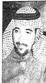
الشيخ أحمد العيبان