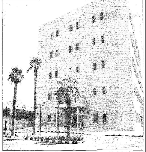
مبانيات إحدى طرق الأحساء

4 مليارات لـ «79» مشروعا بالبلدية و57 مشروعا للتعليم و579 مليونا للنقل