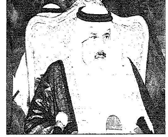
سمو وزير الداخلية خلال رعايته المؤتمر

◆ وزير الصحة: الاهتمام بصحة الحجيج يبدأ من مدارجهم للسفارات حتى مفادتهم إلى بلادهم