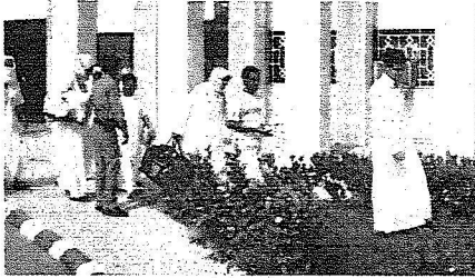
سماعة غامرة بالعفو الملكي