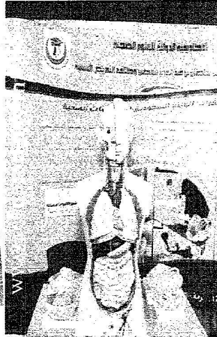
الركن العظمى المشارك في المرأة العصرية.