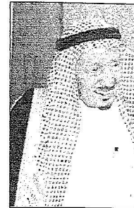
محمد بن احمد العيسی