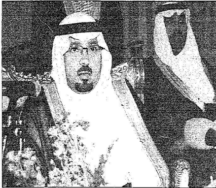
الأمير مشعل بن علي كلفه بالحل

وسمو ولي عهده الامين وسمو النائب الثاني واستقراره انه سيمع مجيب. وقد تناول الجميع طعام العشاء. حضر الحفل الكريمة من خادم الحرمين الشريفين بشمول أصحاب الفضيلة القضاة ومدبرو الإدارات سجناء أحداث نجران بالغفو الكريم في هذا الحكومية وقادة القطاعات الأمنية وأعضاء مجلس المنطقة وعدد من المسؤولين من مدنيين الشهي الفضيل رافعين الولاء والطاعة للقيادة التحكيمية ساتين الله ان يدوم على هذا الوطن أمنه وعسكريين.