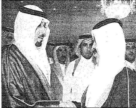
سموه يرحب بالسجناء المفرج عنهم