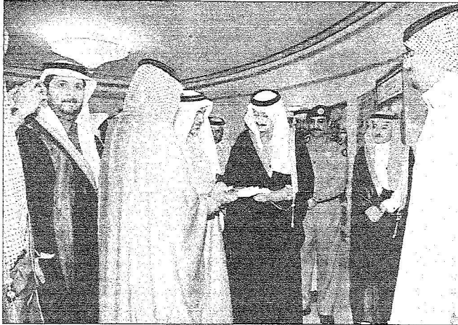
الأمير بدر يتطلع بعض إصدارات النادي