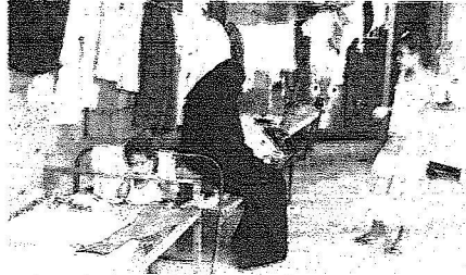
حالة من اليأس

الغالي واكدت الأميرة سارة العنقري ان دعوة خادم الحرمين الشريفين الملك عبدالله بن عبدالعزيز لمكافحة الفقر وبناء المساكن للفقراء بدلا من العشوائيات هي إحدى الصور المضيئة والباركة مشيرة الى ان