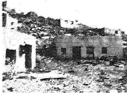
بيوت الأهالي السابقة