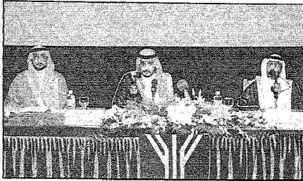
سموه راعياً للحفل