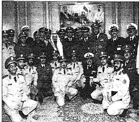
و الملحقين العسكريين السعوديين