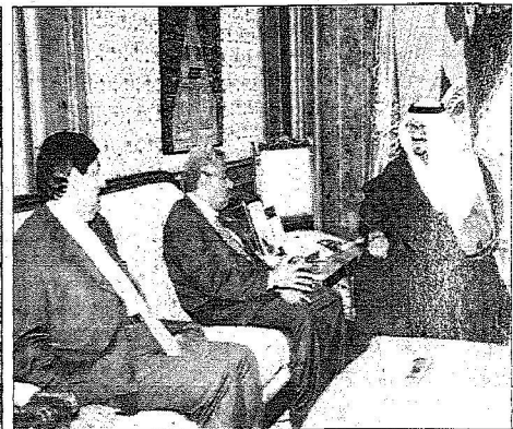
ولي العهد يستقبل وزير التعليم العالي اليمني