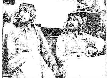
الأمير متعب بن عبدالله مع أخيه الأمير خالد