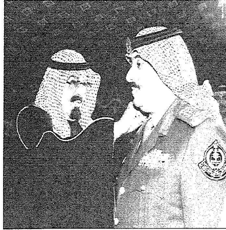
خادم الحرمين الشريفين يقبل الأمير متعب رتبة فريق