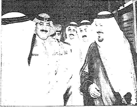
الأمير متعب بن عبدالله مع ولي العهد الأمير سلطان بن عبدالعزيز