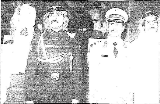
الأمير متعب بن عبدالله في إحدى مناسبات الحرس الوطني