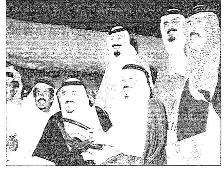
الأمير متعب بن عبدالله في الجنادرية مع الملك فهد رحمه الله وخادم الحرمين الشريفين والأمير مشعل بن عبدالعزيز والأمير بدر بن عبدالعزيز