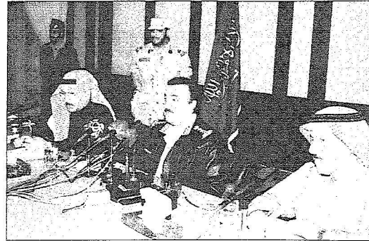
الأمير متعب بن عبدالله في أحد مؤتمرات الجنادرية