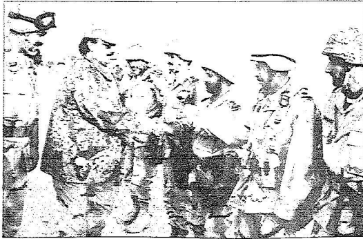
الأمير متعب بن عبدالله يتفقد قوات الحرس الوطني في معسكراتهم