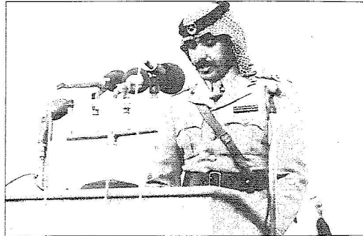
الأمير متعب بن عبدالله في بداية التحاقه بالحرس الوطني