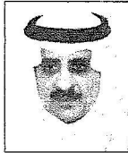
الأمير فهد بن سلطان

الملكي الأمير فهد بن سلطان بن عبد العزيز أمير منطقة تبوك سلامة التدابير والإجراءات الأمنية والخدمية التي اتخذتها كافة أجهزة الدولة