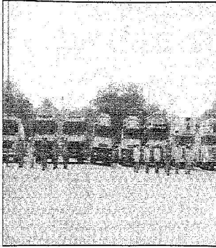
رجال الدفاع المدني مكثرون بالسيارات الطبية في جدة