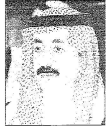
الأمير بنذر بن سعود بن خالد

تخطا مؤسسة الملك فيصل الخيرية الآن للاستفادة من خبرات وجهود الباحثين والعلماء