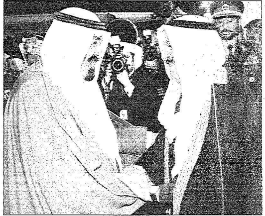
خادم الحرمين لدى وصوله الكويت