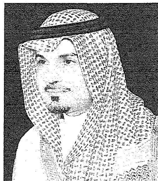
الامير عبدالعزيز بن ماجد