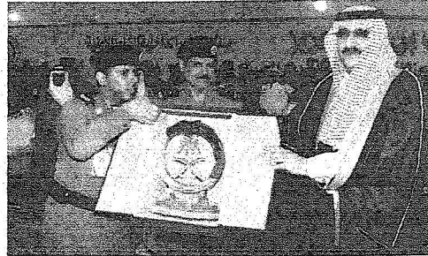
الامير محمد بن نايف يتسلم ترحماً تذكارية