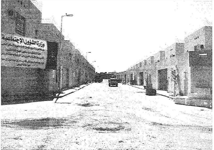
من مشاريع مؤسسة الملك عبدالله لوالديه للإسكان التنموي

- بالتأكيد لا، فإن دور المؤسسة لا يتوقف عن حد تسليم السكن للمستفيدين، بل يتعداه إلى متابعتهم بعد التسليم والتأكد من معرفتهم لواجباتهم وحقوقهم والانضمام بالأنظمة واللوائح الخاصة بذلك