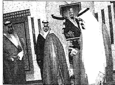
الملك عبدالله خلال استقباله الأمير محمد بن نواف

وعده من أصحاب المعالي الوزراء وكبار المسؤولين. كما استقبل خادم الحرمين الشريفين الملك عبدالله بن عبدالعزيز آل سعود حفظه الله في الديوان الملكي بقصر اليمامة أسس أصحاب السمو الملكي الأمراء وأصحاب المعالي الوزراء وكبار موظفي الديوان الملكي وكبار موظفي ديوان رئاسة مجلس