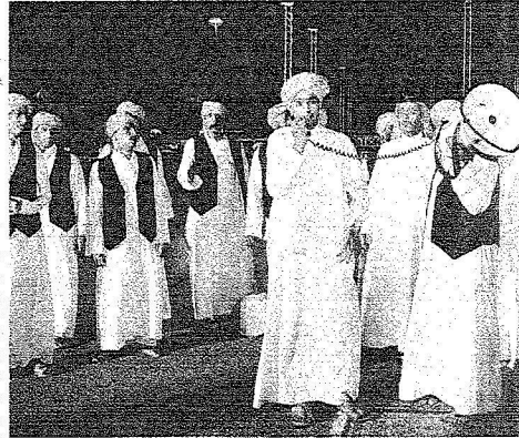
جانب من البروقات النهائية للعبة الصهبة