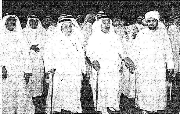
د. يماني وثقيبه وقدعق يتابعون الاستعدادات

أكثر من ٩٠٠ شخص من أبناء مكة المكرمة سيشاركون في رسم لوحة شعبية متكاملة.. تجسد المقامات اليمانية والحجازية ورقصات المزمار ولعبة الصهبة كل هذه الألوان الشعبية ستكون حاضرة بقوة في الحفل الكبير الذي يقيمه أهالي مكة المكرمة تكريماً لخادم الحرمين الشريفين الملك عبد الله بن عبدالعزيز حفظه الله بمناسبة توليه مقاليد الحكم.