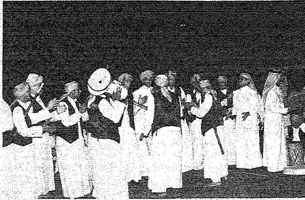
الفرق الشعبية تؤدي لعبة المزمار