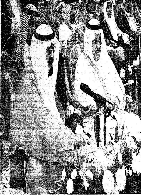
...وما يضفي إليه من شأنه وأهميته الاقتصادية والسياسية، وذلك في إطاره الملكي.