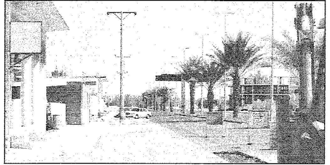
مشاريع الطرق تحظى بمعاينة مستمرة