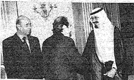
خادم الحرمين خلال استقباله عددا من السفراء العثمانيين لدى المملكة