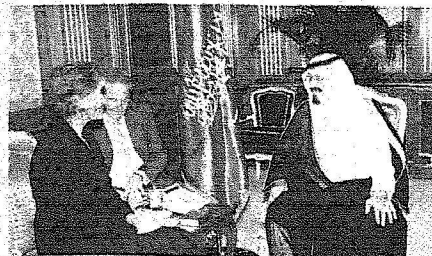
المليك يستقبل وكالة وزارة الخارجية الأمريكية