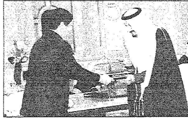
الأمير متعب يتبادل نسخ عقد قطار المشاعر المقدسة

وشملت المباحثات كذلك الأوضاع في عدد من مناطق التوتر في منطقة الشرق الأوسط والعالم، وموقف البلدين الصديقين منها إضافة إلى أعمق التعاون بين البلدين وسبل دعمها وتعزيزها في جميع المجالات بما يخدم مصالحهما المشتركة. حضر جلسة المباحثات من