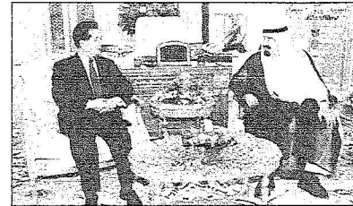
خادم الحرمين والرئيس الصيني خلال جلسة المباحثات

الرياض وبكين تؤكدان على تحقيق سلام عادل يضمن الشعب الفلسطيني حقه في دولة مستقلة