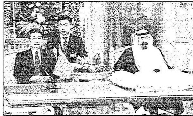
المليك والرئيس مو جينتاو يشهدان توقيع الاتفاقيات