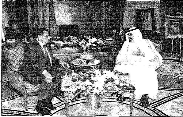
المباحثات بين الزعيمين

المصدر : البلاد التاريخ : 03-06-2008 العدد : 18816 الصفحات : 2 المسلسل : 15