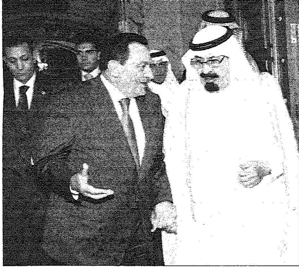
خادم الحرمين يكرم الرئيس مبارك

وعقب استراحة قصيرة في صالة تشريفات المطار صحب خادم الحرمين الشريفين الملك عبدالله بن عبدالعزيز آل سعود أخاه فخامة الرئيس محمد حسني مبارك في موكب رسمي إلى قصر خادم الحرمين الشريفين.