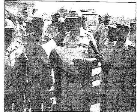
الأمير خالد بن سلطان يوجه كلمة لرجال الأمن

مساعد وزير الدفاع والطيران والمفتش العام للشؤون العسكرية يتفقد قواتنا المرابطة :