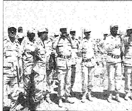
سموم يشرف على العمليات (و.ا.س)