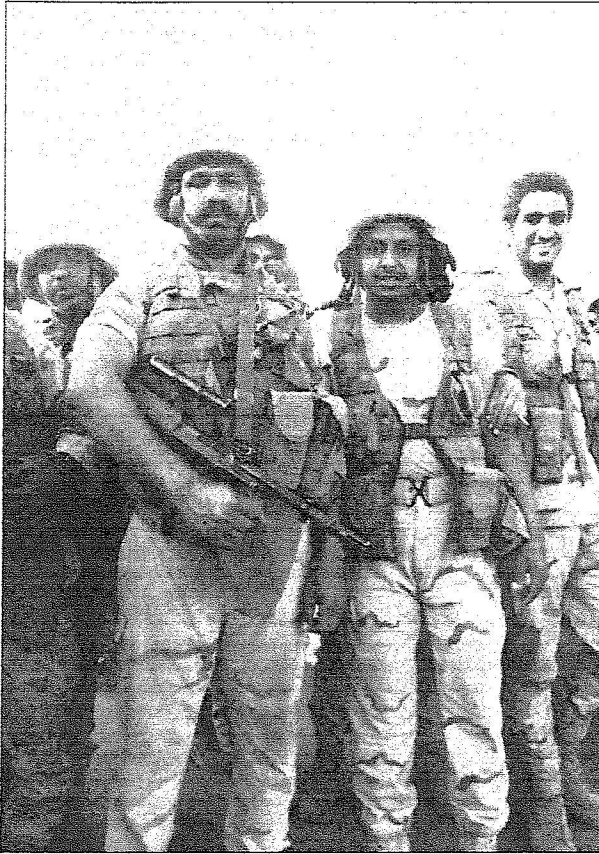
رجال الأمن جاهزون لحسم المعركة