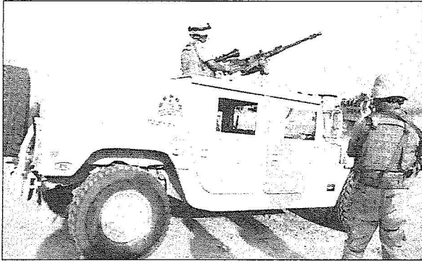
القوات البرية في الطريق الى أرض المعركة