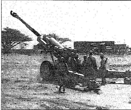
جانب من العمليات