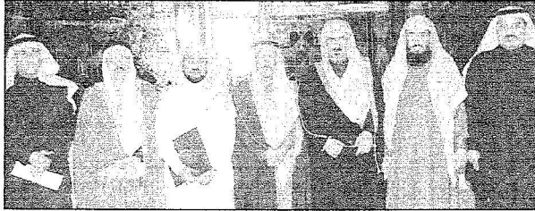
مدير جامعة الإمام ورئيس مجلس إدارة الغرفة التجارية وعدد من المشاركين في الاجتماع