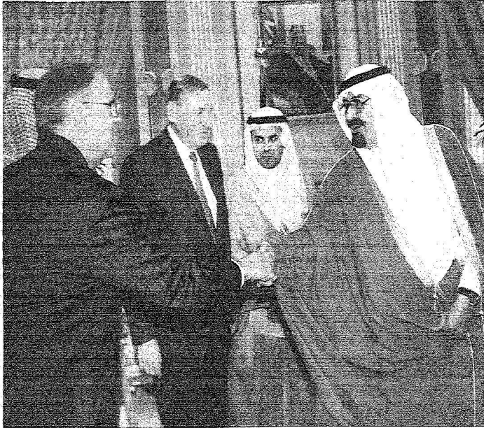
خادم الحرمين الشريفين لدى استقباله لبيسر كارون رئيس مجلس شيكاغو للشؤون العالمية يرافقه 30 من أعضاء المجلس.