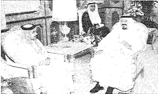
ويستقبل رئيس مجلس هيئة حقوق الانسان