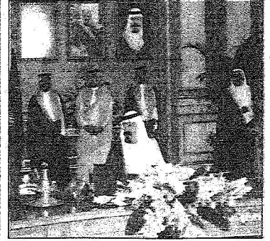
خادم الحرمين الشريفين لدى ترؤسه جلسة مجلس الوزراء (أ.س)