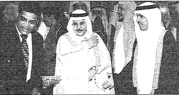
وكيل وزارة الداخلية الدكتور أحمد السالم ومستشار النائب الثاني الدكتور ساعد الحارثي في حفل معايدة منسوبي الوزارة أمس.