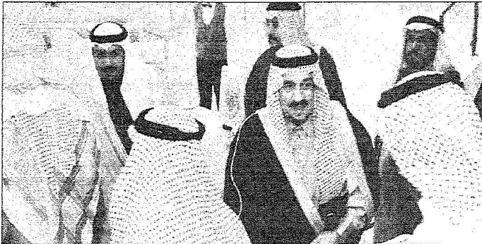
أمير منطقة القصيم يتلقى التهنئة بعيد الأضحي في بريدة أمس.