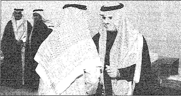
وكيل إمارة منطقة الرياض في حفل استقبال المئتين بعيد الأضحى في الرياض أمس.