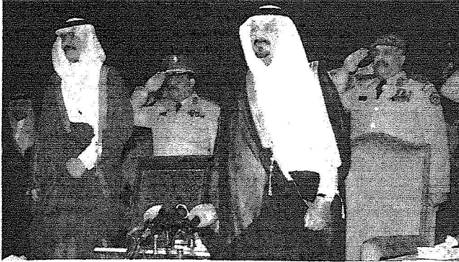
ولي العهد خلال معاينته مشوي القوات المسلحة في المنطقة الشرقية أمس، ويبدو الأمير محمد بن فهد.

خالد، الأمير منصور بن سعود بن عبد العزيز، الأمير سعد بن فيصل بن سعد، الأمير خالد بن سعد بن فهد، الأمير خالد بن فهد بن محمد، الأمير سطات بن سعود بن عبد العزيز، الأمير فيصل بن سعود بن محمد، الأمير فيصل بن سلطان بن عبد العزيز الأمين العام لمؤسسة سلطان بن عبد العزيز الخيرية، وجميع من الأمراء وكبار المسؤولين من مدنيين وعسكريين.