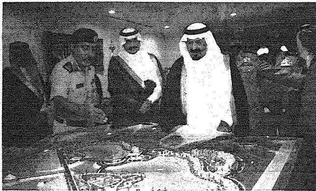
الأمير سلطان يتطلع على مجسم مشروع المتنزّه البحري في مدينة الملك فهد العسكرية.

هدية تذكارية بهذه المناسبة عبارة من بندقية أثرية خاصة بالملك عبد العزيز، قدمها قائد المنطقة الشرقية. ثم شرف ولي العهد حفل الغداء الذي أقامته قيادة المنطقة الشرقية تكريماً له. ثم غادر الأمير سلطان مقر الحفيل مودعاً بالحفاوة والترحاب. وكان ولي العهد قد اطلع عقب وصوله إلى مدينة الملك فهد العسكرية على مجسم لمشروع تطوير مركز الأمير سلطان البحري الخاص بمدينة