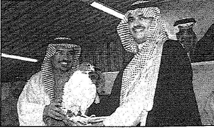
جانب من توزيع الجوائز على الفائزين