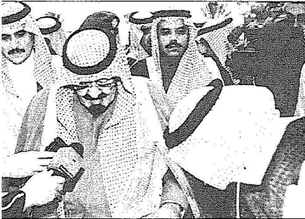
خادم الحرمين الشريفين يضع حجر الاساس للجيل 2 (2004م)

تتشرف مدينة الجيل الصناعية بالزيارة الميمونة التي يقوم بها خادم الحرمين الشريفين الملك عبدالله بن عبدالعزيز ويرافقه خلاله صاحب السمو الملكي الامير سلطان بن عبدالعزيز ولي العهد نائب رئيس مجلس الوزراء وزير الدفاع والطيران المفتش العام واصحاب السمو الامراء والمعالى الوزراء وكبار المسؤولين في الدولة. حيث يتفضل - ايده الله - برعاية الحفل الكبير الذي تقيمه الهيئة الملكية للجيل وينبع وشركة سابك وشركات القطاع الخاص ويبدشن خلاله المرحلة الاولى من الجيل 2 كما يدشن ويضع حجر الاساس لعشرين مشروعا باستثمارات تقدر بنحو ثلاثة واربعين مليار ريال. ويبلغ عدد المشاريع الخاصة بالهيئة الملكية تسعة مشاريع فيما تبلغ المشاريع الخاصة بشركة سابك خمسة مشاريع واستحوذت شركات القطاع على ستة مشاريع.