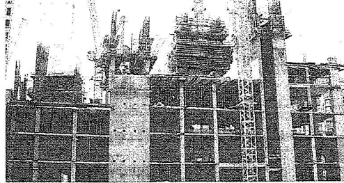
مشروع وقف الملك عبدالعزيز