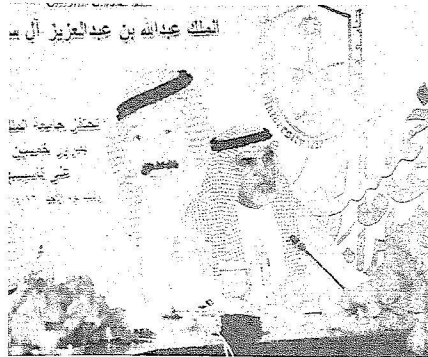
الملك عبدالله بن عبدالعزيز آل سعود

وبين معاليه أن الفعاليات ستشمل حفلاً اجتماعياً مفتوحاً