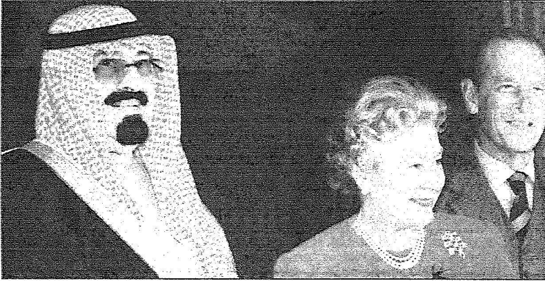
خادم الحرمين الشريفين وملكة بريطانيا في لقاء سابق