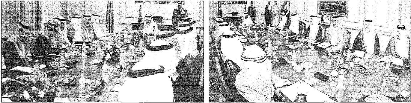
سمو النائب الثاني خلال اجتماعه مع أمراء المناطق

الإشادة بالإجازات الأمنية لسمو مساعد وزير الداخلية ورجال الأمن وخاصة في مكافحة الإرهاب..