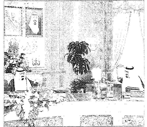
المليك وولي العهد في جلسة مجلس الوزراء