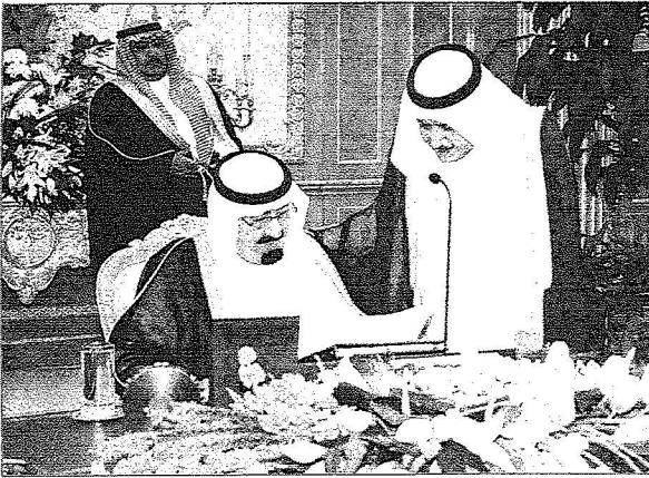
الملك يتطلع على التوصيات الخاصة بمنع تناول ثمرات الامونيموم والى جواره الامير نايف

﴿ تحديد اربع شركات او مؤسسات سعودية لاستيرادها وبيعها على المزارعين المصرح لهم ﴾