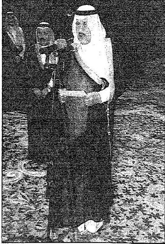
الأمير نايف بن عبدالعزيز