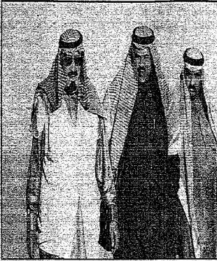
الملك عبدالله يتناول في الضواحي

تلقي نبأ وفاة الملك فهد الساعة الثالثة فجراً وتوجه إلى المستشفى مباشرة ليلقي نظرة الوداع على أخيه التويات الأمنية للملك عبدالله تتغير لحظة لقاء، انه بالمواطنين ويقول لمن حوله: «لا تعرفوني رؤية شعبي.. العاهي هو الله»