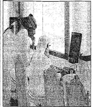
الملك عبدالله يتفق من غرفة الملكيات بين الخدماء المتقدمة للخدمة

الوفود الأجنبية التي رارته في روضة خريم تفاجأت بأن مكان إقامته لا يتعدى «أمتاراً» عن خيام المواطنين