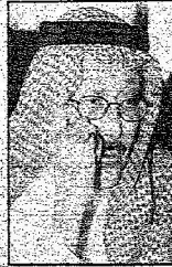
الملك عبد الله الثاني الملك عبد الله الثاني

خادم الحرمين ينظر للإنسان الصادق بأنه أول المعترفين بخطئهم.. ويكره التملق والحديث عن الآخرين