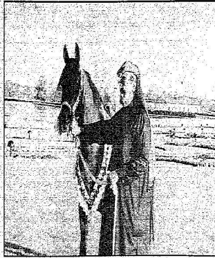
طاقم الحرمين يستعد بأدنى الأمان داخل من بيت