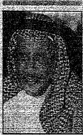
الملك عبد الله الثاني الملك عبد الله الثاني

التاريخ : 22-11-2005 العدد : 13665 الصفحات : 3 المسلسل : 15