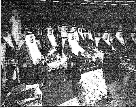
خادم الحرمين راعياً الحفل وإلى يمينه سمو ولي العهد