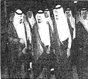
الملك عبدالله والأمير سلطان يهلان إلى مقر الحفل والأمير سلطان في استقبالهما

للرياض في نفوس أبناء المملكة مكانة خاصة فمنها انطلقت طلائع التوحيد على يد المؤسس