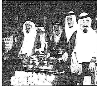
الملك عبدالله والأمير سلطان وحديث باسم مع الأمير سلمان