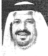
أمير منطقة حائل