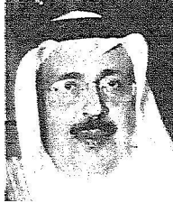
وزير التعليم العالي