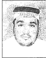
الهندس محمد بن زايد