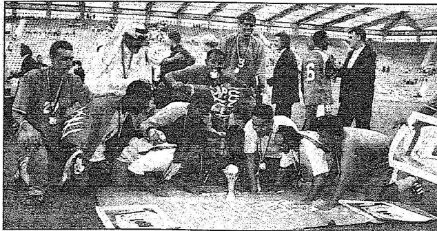
من احتفالات منتخبنا بكأس العالم

المصدر : الرياض التاريخ : 08-10-2006 العدد : 13985 الصفحات : 17 المسلسل : 146