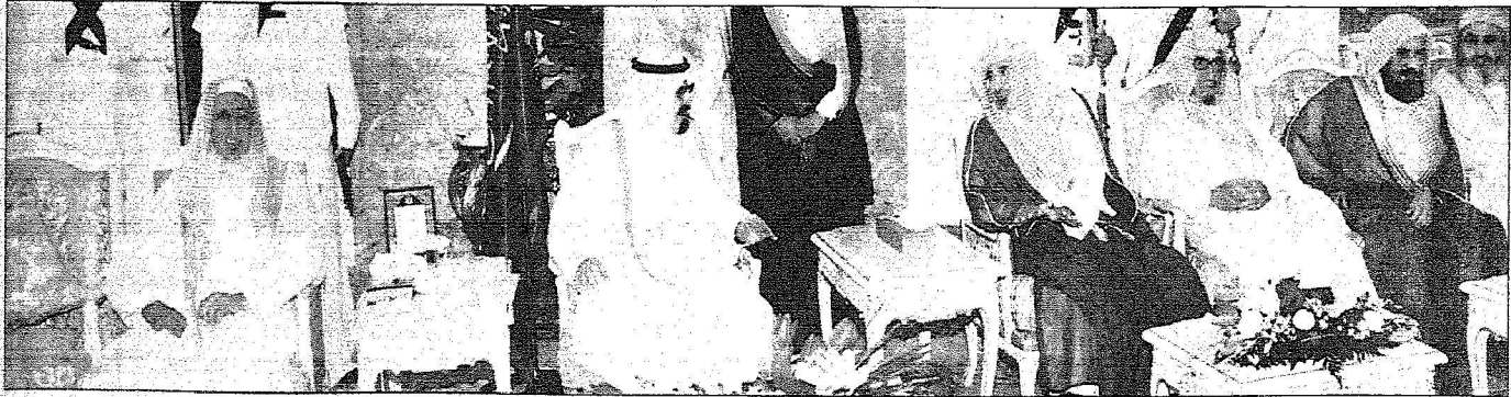
خادم الحرمين الشريفين متحدثاً إلى رئيس المجلس الأعلى للقضاء، بحضور المفتي عند لقائه الأمراء والعلماء وقادة وضباط ومنسوبي أمن الحج في منى أمس. (ولس)

مخاطبا القوات العسكرية: أثبتتم أن المعرفة تسبق النصر والجهل يسبق الهزيمة