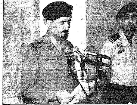
مدير الأمن العام متحدثا أمام خادم الحرمين في منى أمس.