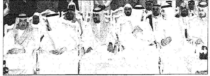
الأمرء يتبادلون الحديث عند حضورهم استقبال الملك في منى أمس.