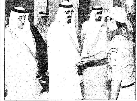
خادم الحرمين مصافحا أحد منسوبي الكشافة في منى أمس.