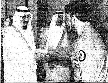
الملك مصافحا أحد ضباط أمن الحج في منى أمس.