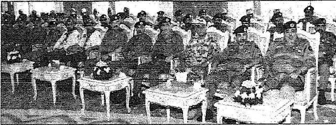
عدد من قادة وضباط ومنسوبي أمن الحج في منى أمس.