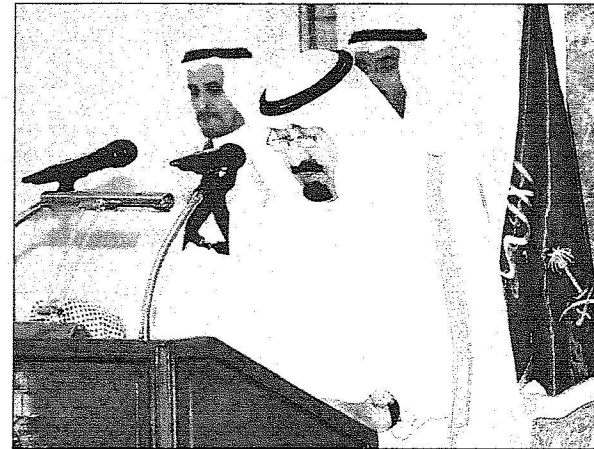
الملك مخاطبا رجال القوات المسلحة في منى أمس.