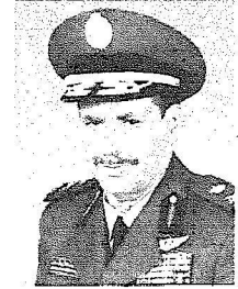
اللواء طيار الركن عبد الله السعدون

كانت حافلة بالجد والاجتهاد، وأنه معتنز بتشريف سمو نائب وزير الدفاع وذلك ليس بغريب على سموه، كما أود أن لا يفوتني أن أشكر كل من ساهم في تدريبنا في هذه الكلية وعلى رأسهم قائد الكلية. آمين أن يوفقنا العزيز الحكيم في حياتنا العملية القادمة.. إن