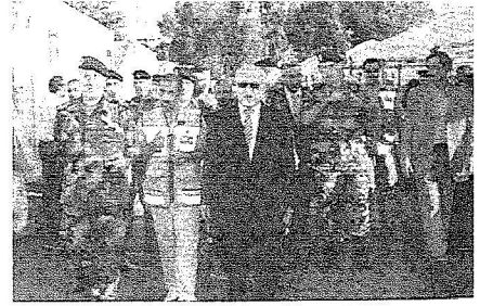
العميد ميشال سليمان والسفير السعوي