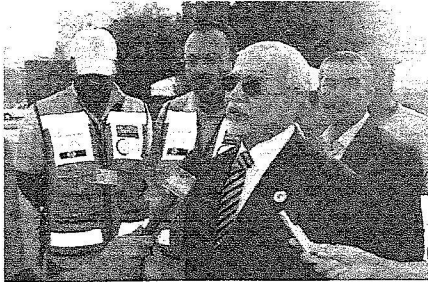
السكرير السعوي يتحدث للإعلاميين

التاريخ : 16-09-2006 العدد : 12406 الصفحات : 5 المسلسل : 23