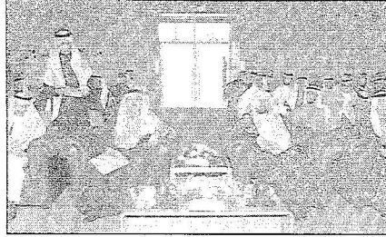
د. العبيد راعياً للحفل